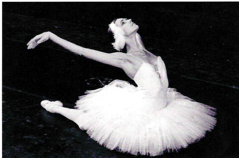
Mirštanti gulbė (1989 m.)

jaudulys, o nervai. Taip nutinka per baigiamuosius egzaminus atliekant mano sukurtą choreografiją. Ir kuo mokinys geresnis, tuo didesnis jaudulys. Savęs net klausiu, ar labiau jaudindavusi pati eidama į sceną, ar dabar. Ir ne todėl, kad mokiniai nepasirengę... Tiesiog neramu, kad kas negerai nenutiktų, kad ant prakaito lašelio nepaslystų, neužliptų ant pėdos ir pan.