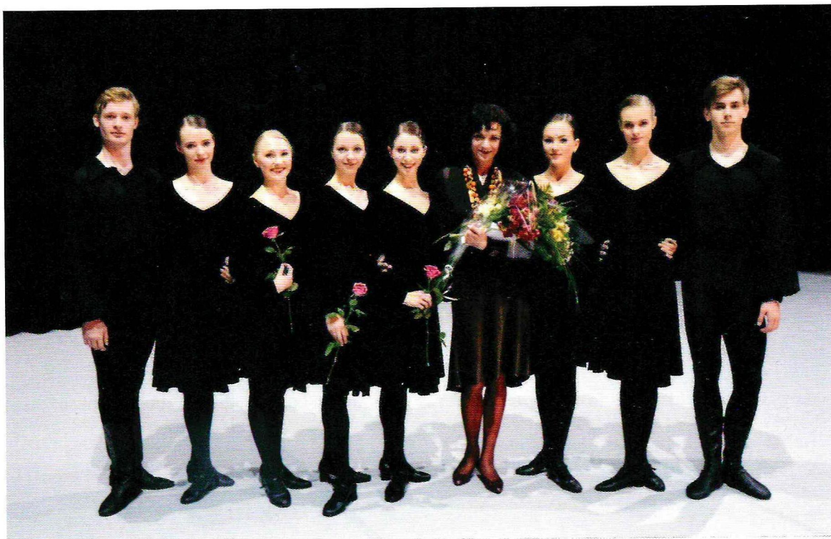
Su mokiniais (M. K. Čiurlionio menų mokyklos baletų skyrius)